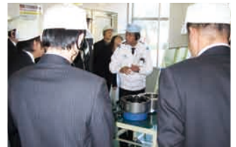
技術講習会での工場見学