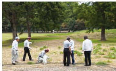
近隣の公園清掃活動