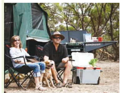
レジャー用冷蔵庫

CSR報告書(Web版)のご紹介 http://www.sawafuji.co.jp/kankyo/kankyo_index.php