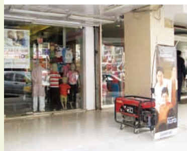
ブティックの電源バックアップ用発電機