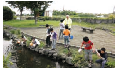
地域 NPO による水質調査