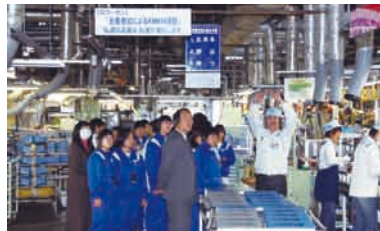
近隣学校の工場見学

毎年、地域社会との交流を深めるために、福祉作業所の方々を招いての交流会、工場周辺の清掃、地域イベント参加などを行っています。