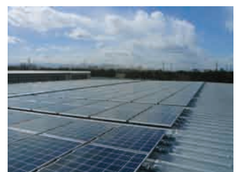
工場の屋上に設置された太陽光発電パネル