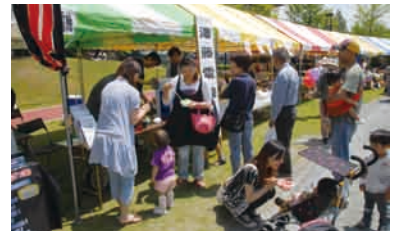
ぐんまふれあいフェスティバル