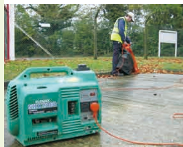
清掃作業で活躍する発電機