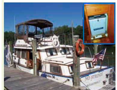
プレジャーボートに装備された冷蔵庫