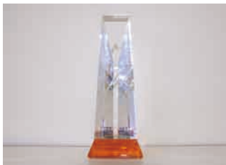
太田市産業振興貢献企業表彰盾

毎年、地域社会との交流を深めるために、福祉作業所の方々を招いての交流会、工場周辺の清掃、地域イベント参加などを行っています。