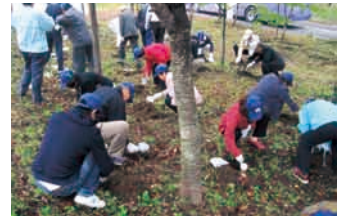
全国育樹祭での育樹作業